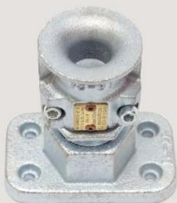
Kabelverschraubungen mit Flansch cable glands with flange