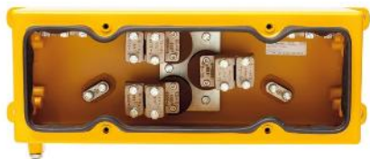
Verbindungsgehäuse junction box 1 kV