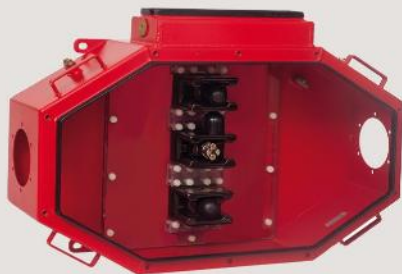
Verbindungsgehäuse junction box 6,6 kV, 11 kV