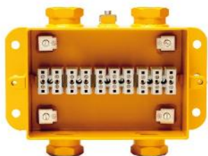
Verteilergehäuse distribution box 1 kV

Zertifiziert für Ex e und Ex nA, Gerätegruppe I und II certified for Ex e and Ex nA, equipment group I and II