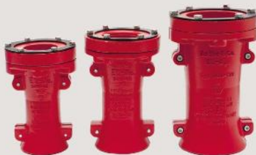
Geteilte Kabelentführungen - Keule two-parted cable glands - lobe