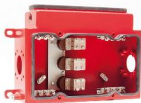
Verbindungsgehäuse junction box 3,3 kV