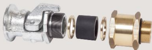
Kabelverschraubungen cable glands

certified for Ex e and Ex d, equipment group I and II