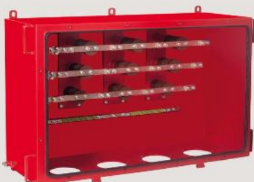
Sammelschienegehäuse bus bar box 1 kV, 6,6 kV, 11 kV