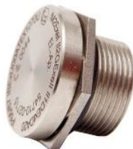
Druckausgleichselemente pressure compensating elements